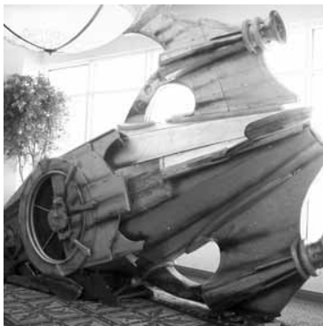
大きい宇宙船模型の展示。左の窓内が光る！ なんと「FOR SALE(販売)」だったりする。

シアトル・タコマ空港の眼前のホテル&コンベンションセンターが会場だった CascadiaCon. Interaction に参加しなかったファンを中心にアピールしてきました。